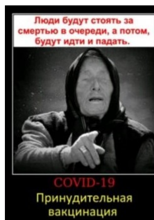
Рис. 2. Конспирологическая аргументация (Соцсети, изображение с текстом, 05.08.2021)

Распространёнными иллюстрациями являются подложные фотографии или видеоизображения – достоверные иллюстрации, которые используются в ложном контексте, а также сфальсифицированные иллюстрации – отредактированные видеокadres и изображения (рис. 3).