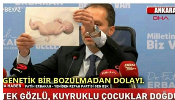
Рис. 3. Отредактированная фотография (Соцсети, пост с иллюстрацией, 08.10.2021)

Турецкий новостной канал Beyaz TVB сообщает: в Турции дети рождались с несколькими ногами и руками, а также с хвостами животных! Матери были вакцинированы Biontech и Moderna. Таких младенцев родилось Много!